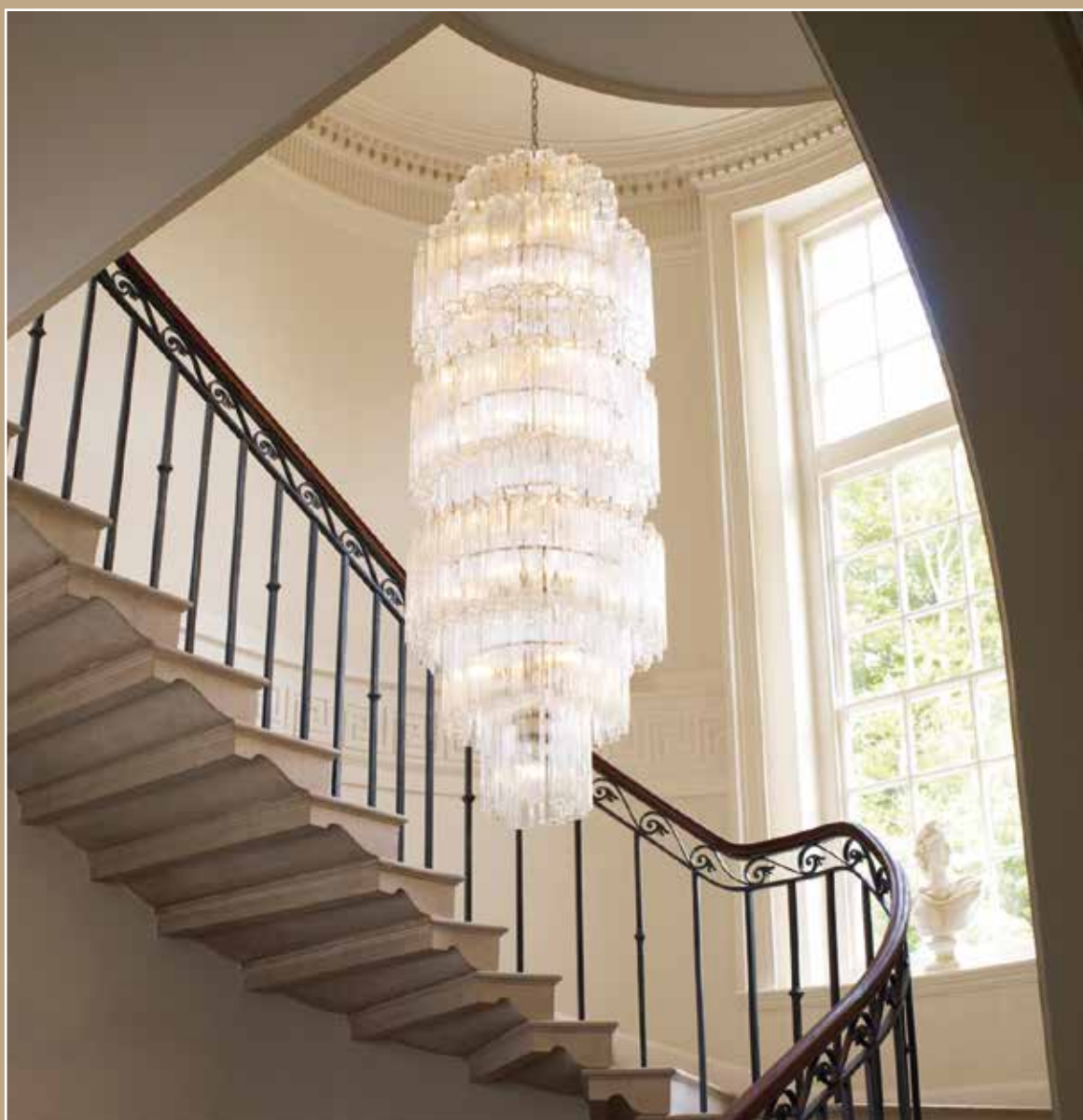
Een moderne glazen kroonluchter in een klassieke omgeving. De combinatie van glas en warm (led)licht geeft altijd een extra dimensie aan een ruimte en is makkelijk toepasbaar. Foto lamp Vaughan.

‘Een verlichtingsplan zou eigenlijk standaard onderdeel moeten uitmaken van een interieurdesign’, zegt interieurdesigner Issabella van Baaren. Zeker bij monumentale en karakteristieke gebouwen is goede verlichting in staat sterke punten te onderlijnen en de verschillende gebruiksmogelijkheden van een ruimte met één druk op de knop naar voren te halen. ‘Het opstellen van een verlichtingsplan is een leuke breinbreker.’