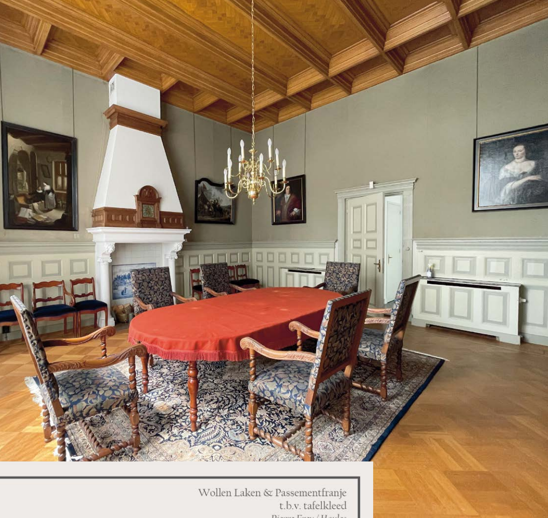
Wollen Laken & Passement franje t.b.v. tafelkleed Pierre Frey / Houles