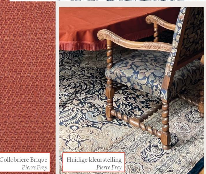
Collobriere Brique Pierre Frey