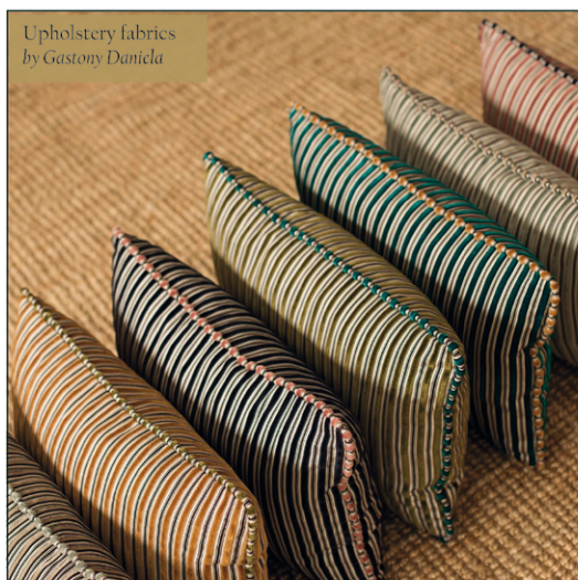
Upholstery fabrics by Gastony Daniela