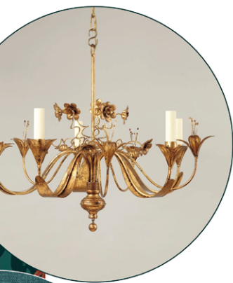
Linen fabric by Lewis & Wood