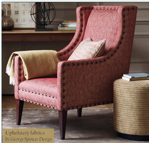
Upholstery fabrics by George Spencer Design