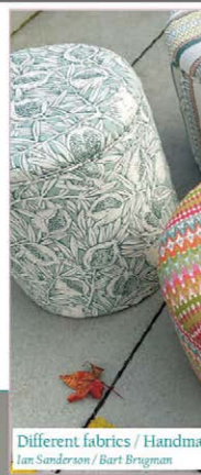
Different fabrics / Handmade Jan Sanderson / Bart Bragman