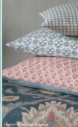
Lewis & Wood / Bart Bragman